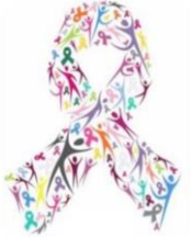
تعافي جازان لمرضى السرطان

وذلك بتاريخ ١٠ / ٩ / ١٤٤٥ هـ الموافق ٢٠ / ٣ / ٢٠٢٤ م